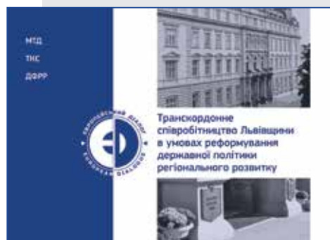
Państwowy fundusz rozwoju regionalnego: mechanizm/procedury przygotowania i wyboru projektów rozwoju regionalnego