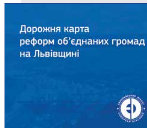
Mapa drogowa dla reformy zrzeszonych wspólnot obwodu lwowskiego