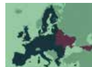
Stowarzyszenie Centrum Współpracy Polska-Wschód