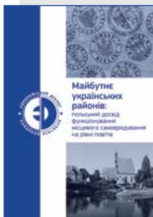
Przyszłość rejonów Ukrainy: Polskie doświadczenie funkcjonowania samorządu na szczeblu powiatu