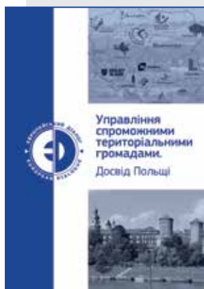
Zarządzanie zdolnymi wspólnotami terytorialnymi. Doświadczenie Polski