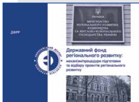
Współpraca transgraniczna obwodu lwowskiego w warunkach reformowania państwowej polityki rozwoju regionalnego