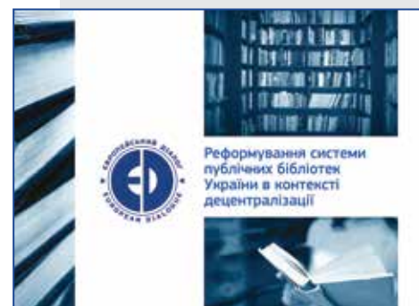
Reforma bibliotek publicznych w Ukrainie w kontekście decentralizacji