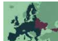
Stowarzyszenie Centrum Współpracy Polska-Wschód