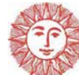
Подільська агенція регіонального розвитку