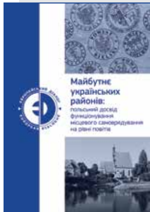
Майбутнє українських районів: польський досвід функціонування місцевого самоврядування на рівні повітів