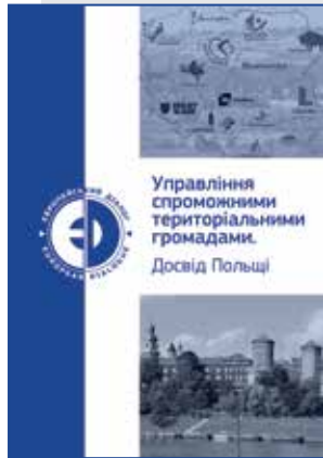
Управління спроможними територіальними громадами. Досвід Польщі