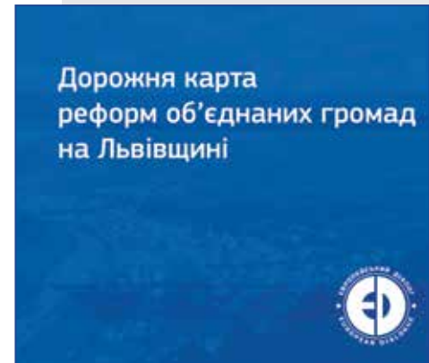
Дорожня карта реформ об'єднаних громад на Львівщині