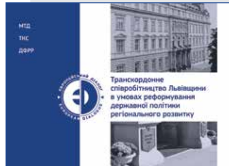
Державний фонд регіонального розвитку: механізм/процедура підготовки та відбору проектів регіонального розвитку