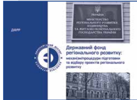
Транскордонне співробітництво Львівщини в умовах реформування державної політики регіонального розвитку