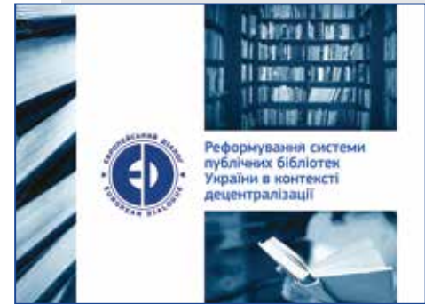
Реформування системи публічних бібліотек України в контексті децентралізації